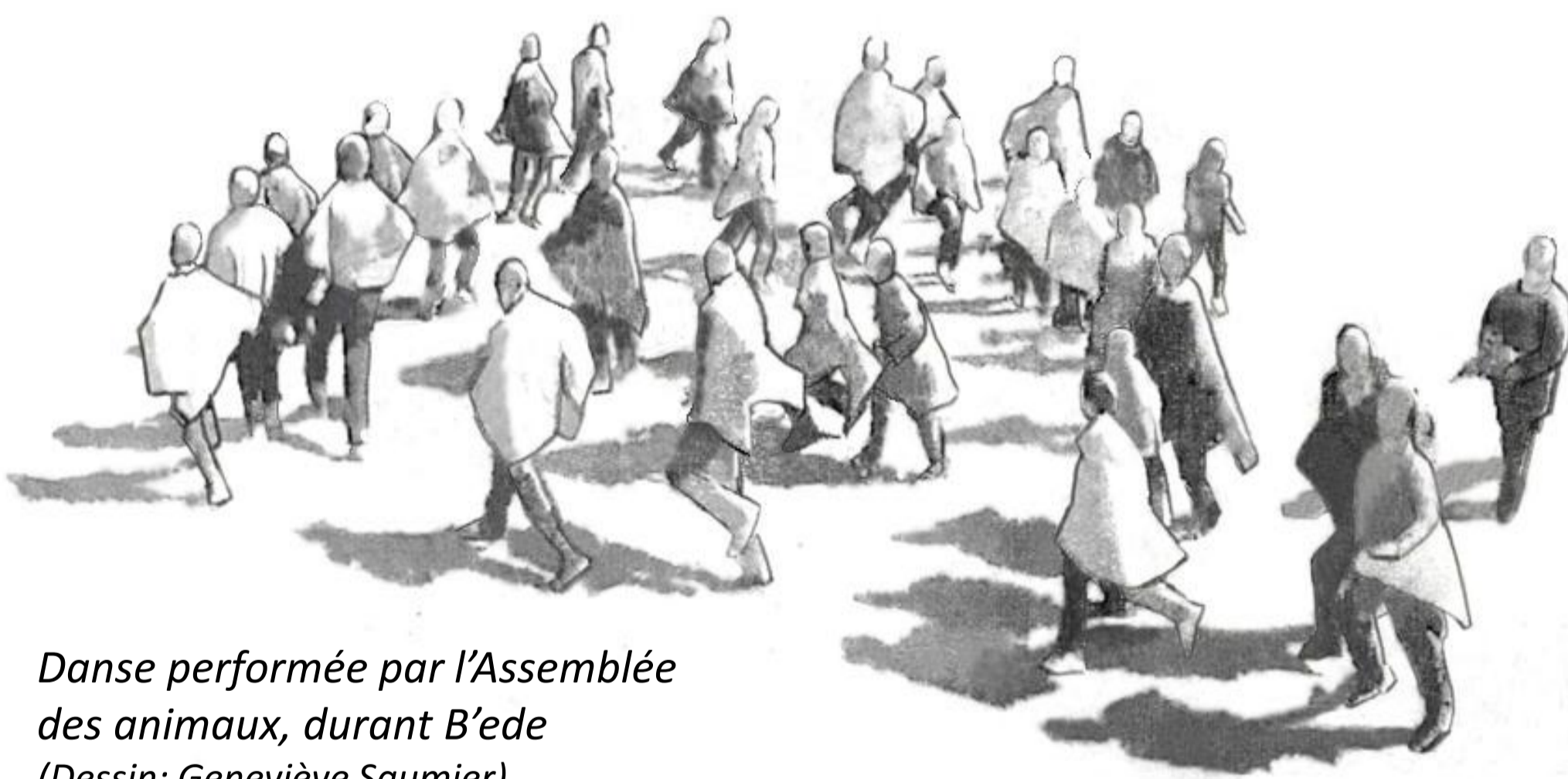
Danse performée par l'Assemblée des animaux, durant B'ede