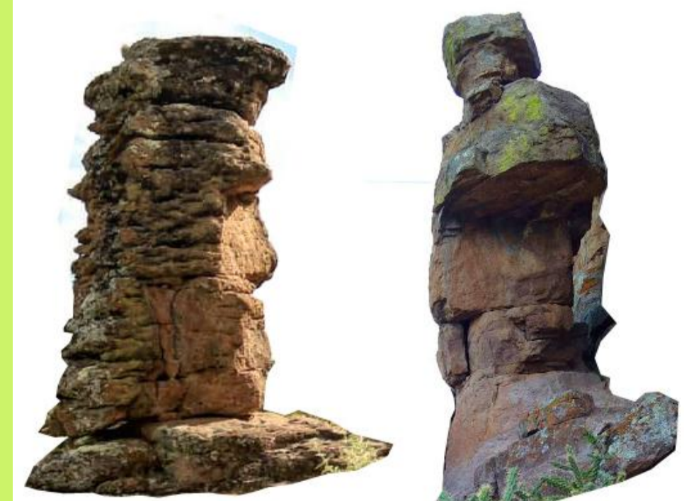
Les « Gardiens »: grands monolithes chichimecas préhispaniques de la région de Victoria, Guanajuato

La notion de recherche-action coopérative fournit un modèle utile pour analyser les recherches engagées intégrant art et anthropologie qui valorisent une articulation horizontale des acteurs. Dans le cas de B'ede, l'analyse permet d'identifier l'importance de renforcer la conscience et la position de tous les acteurs en tant que co-sujets et citoyens d'un monde social commun qui fait l'objet de la recherche. Cette analyse guidera la formulation d'un projet de recherche partenarial dans le cadre de mon doctorat en Études et pratiques des arts à l'UQAM.