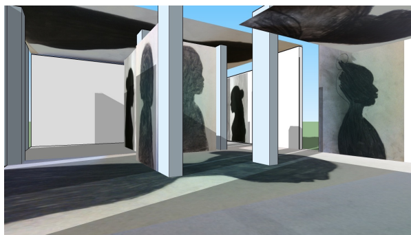
Courier, C. (2019). Maquettes pour l'exposition Ombres d'exil, Montréal dans Le Grand Voyage , commissaire : ATSA, mai 2021 www.atsa.qc.ca/le-grand-voyage