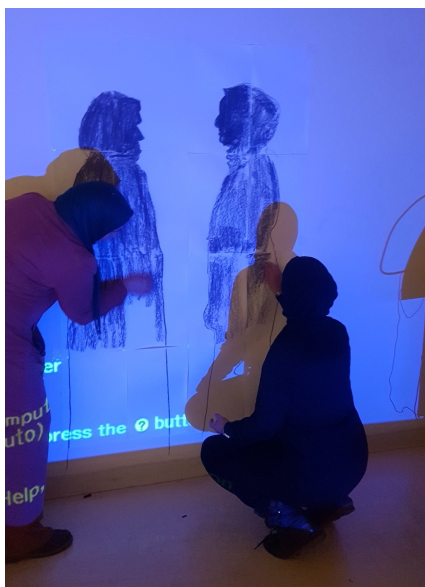
Séance de dessin avec les participantes rejointes via l'organisme « Petites Mains », Montréal, 2019.